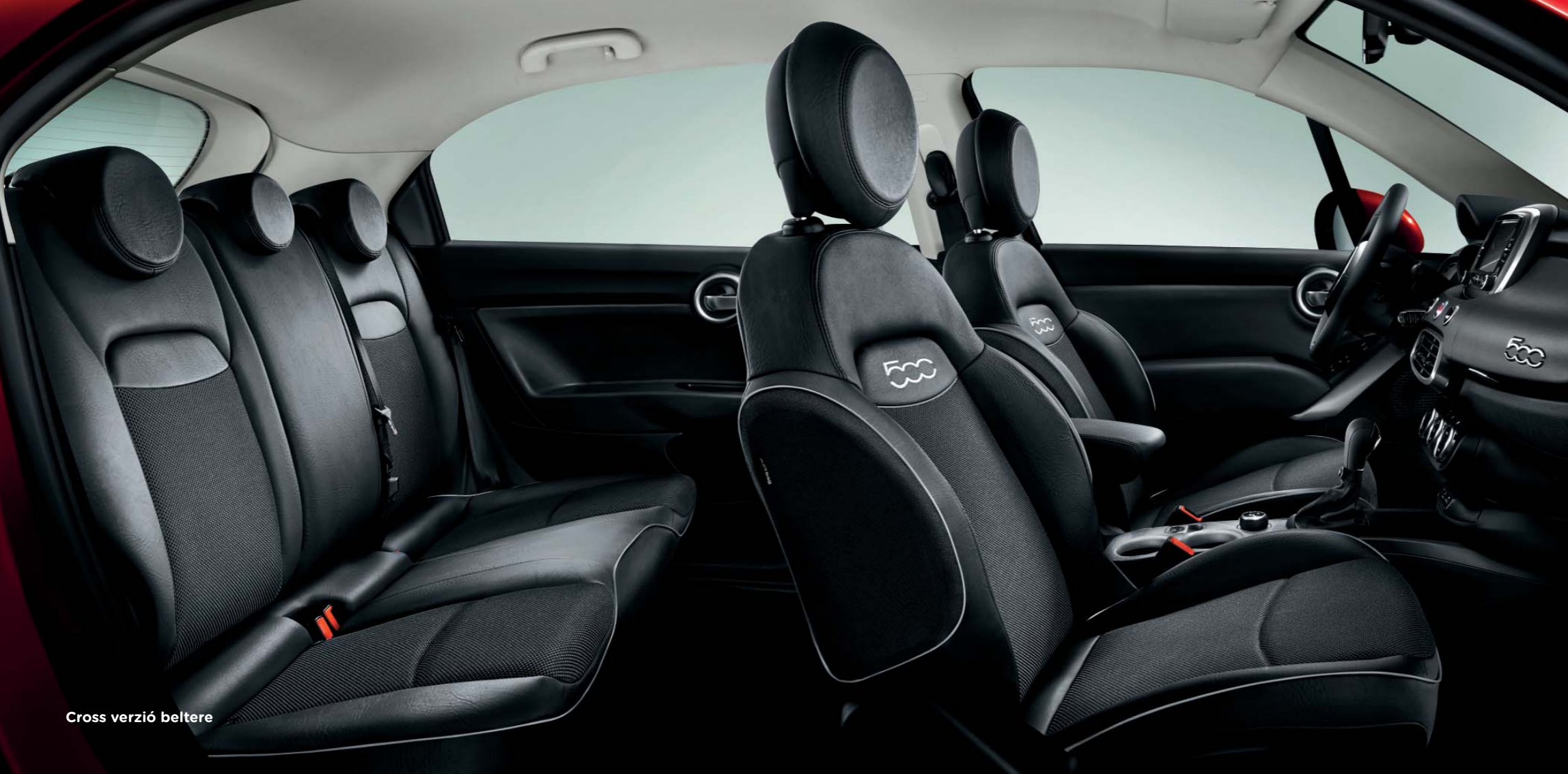
Cross verzió beltére